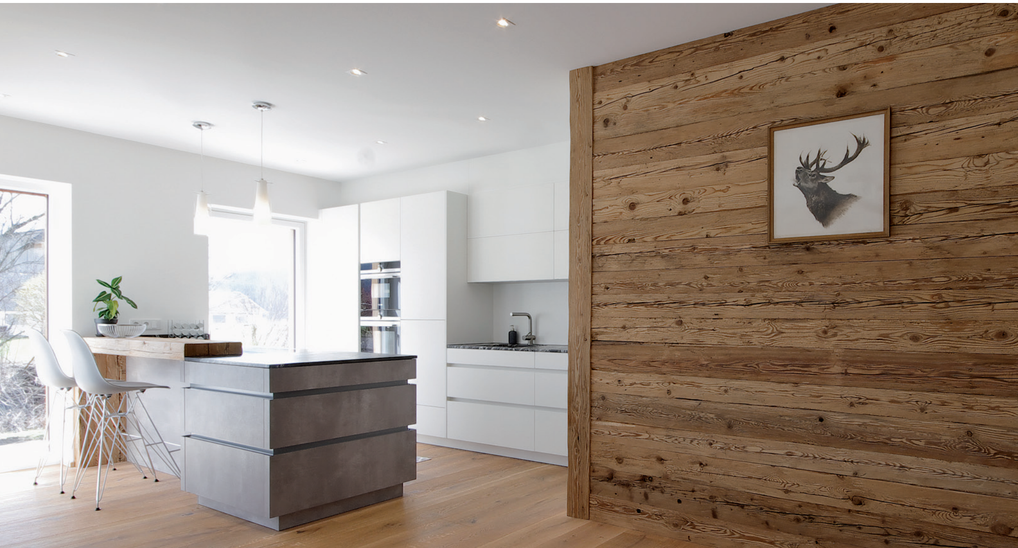
WohnHaus Grill & Ronacher